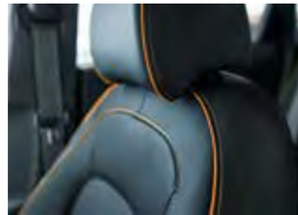
Narančasti šavovi s crnim sigurnosnim pojasevima