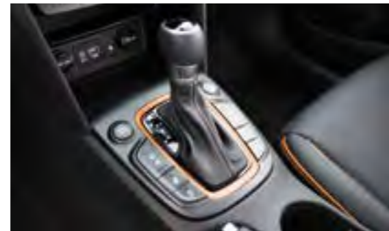
7-stupanjski mjenjač s dvostrukom spojkom (DCT)