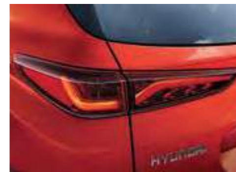
LED stražnja svjetla* Vanjska zrcala u dvije nijanse** s LED pokazivačima smjera