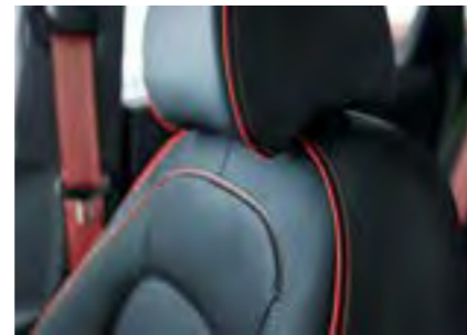
Crveni šavovi s crvenim sigurnosnim pojasevima