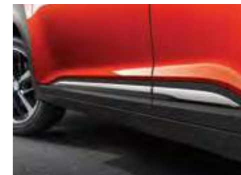
Sportski srebrni bočni pragovi* Krovni i stražnji spojler u dvije nijanse**