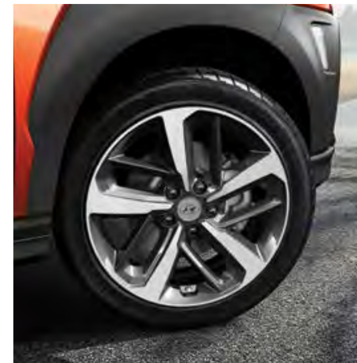
18" aluminijski naplatci***