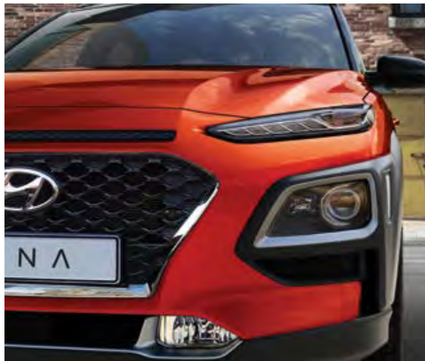
Kaskadna rešetka hladnjaka i dizajn dvostrukih prednjih svjetala

Od kombinacije naglašenih linija i progresivnog modernog stila KONE, zaigrat će vam srce. Smion vanjski dizajn privlači pažnju, a mišićavi skulpturalni oblici, elegantna LED svjetla* i jedinstveni detalji naglašavaju jako Hyundaijevo SUV nasljeđe.