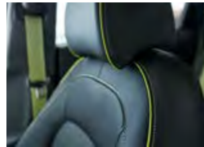
Šavovi u boji limete sa sigurnosnim pojasevima u boji limete