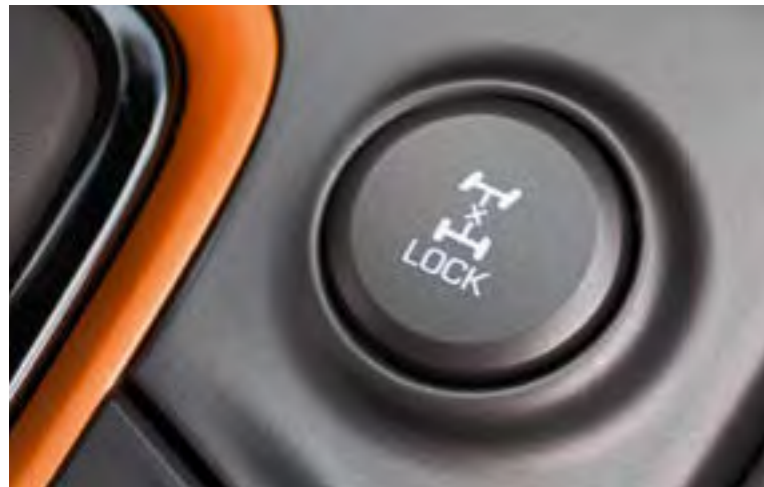
Pogon na sve kotače* na zahtjev

Pratiti cestu je jedno, a uhvatiti zavoj u svom stilu potpuno je drugačiji izazov. KONA ima sustav pogona na sve kotače* na zahtjev, za optimalno rukovanje i performanse u zavojima. Čini vožnju skliskim cestama i neravnim izvangradskim putovima sigurnijom i zabavnijom. Značajka napredne kontrole vuče u zavojima poboljšava agilnost i stabilnost te aktivno raspodjeljuje okretni moment tijekom ubrzanja na zavojitim dionicama. Iz svega toga proizlazi uzbudljiva vozna dinamika – jer nije samo bitno stići do odredišta, gušt je dati si oduška i uživati u svakom trenutku putovanja, zar ne?