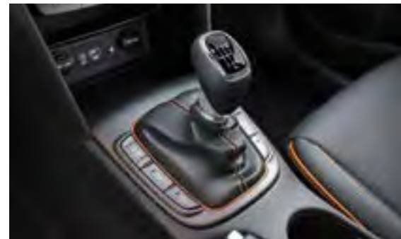
6-stupanjski ručni mjenjač