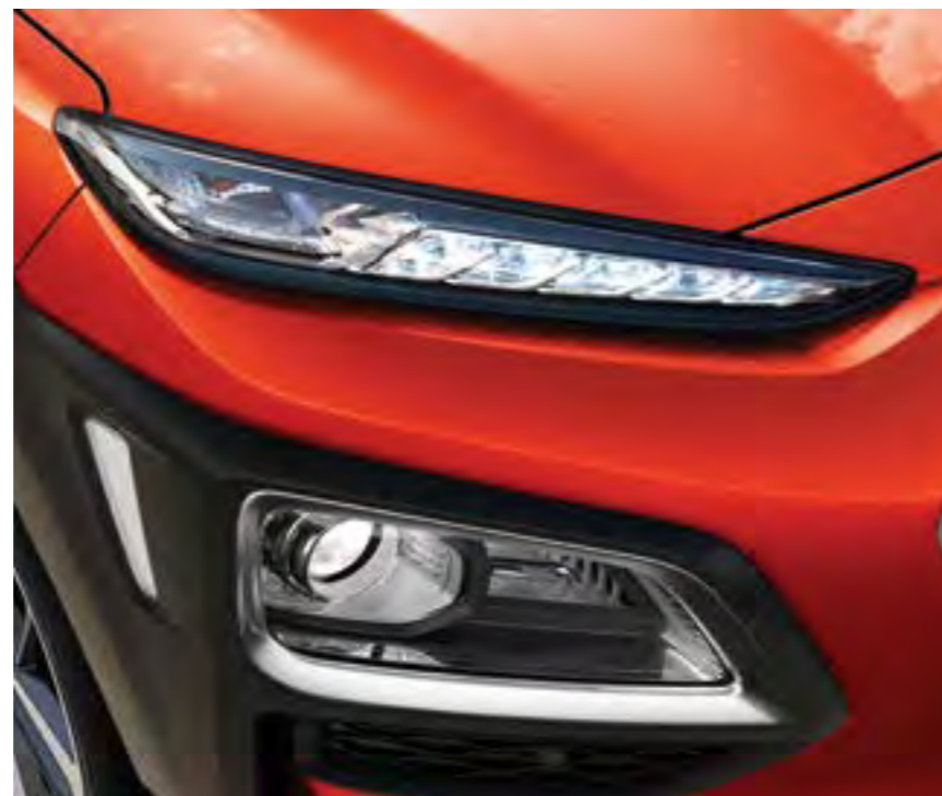
LED prednja svjetla* s dnevnim svjetlima