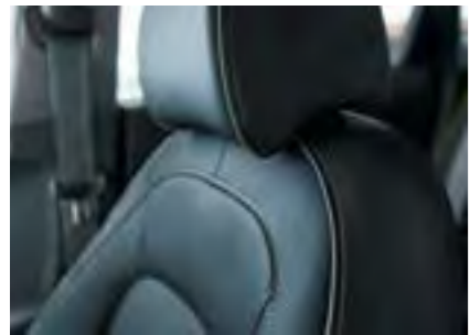
Sivi šavovi s crnim sigurnosnim pojasevima