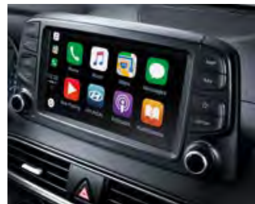
Prvoklasni glazbeni sustav tvrtke KRELL 8" zaslon osjetljiv na dodir***

* Uz audio-navigacijski uređaj ** Ovisno o verziji *** Dostupan ovisno o verziji